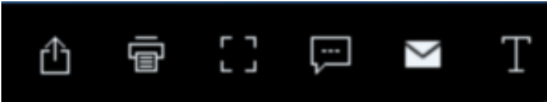
Fig. 1 Selezionare l'icona Stampante